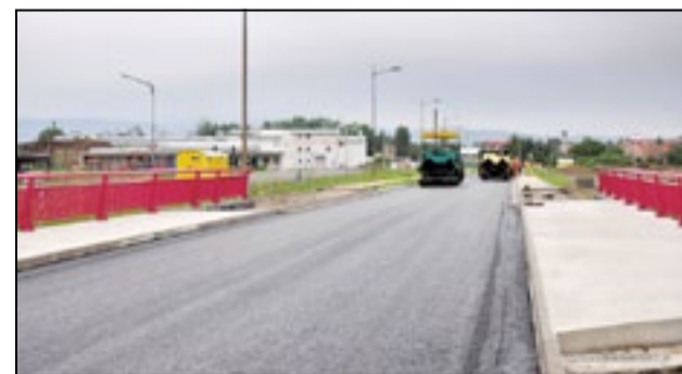
Kolejny etap remontu ul. Staszica wymaga zmiany w organizacji ruchu

W przypadku potrzeby uzyskania szczegółowych informacji, bądź uwag o zmienionej, tymczasowej organizacji ruchu można się kontaktować z kierownikiem budowy Stanisławem Świącikiem, tel. 602 398 800 lub inżynierem budowy Jakubem Koroną 663 977 481.