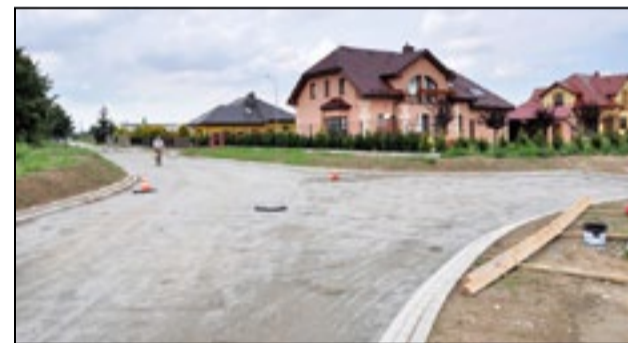
Mieszkańcy os. Makowego zyskają wygodną drogę dojazdową

W tym roku zakończyła się przebudowa dzierżoniowskiego targowiska, końca dobiegają prace związane z uporządkowaniem gospodarki wodno-ściekowej. Ostatnie prace prowadzone są w drugiej już hali produkcyjno-magazynowo-biurowej Invest-Park Development, ulokowanej w sąsiedztwie dzierżoniowskiej podstrefy.