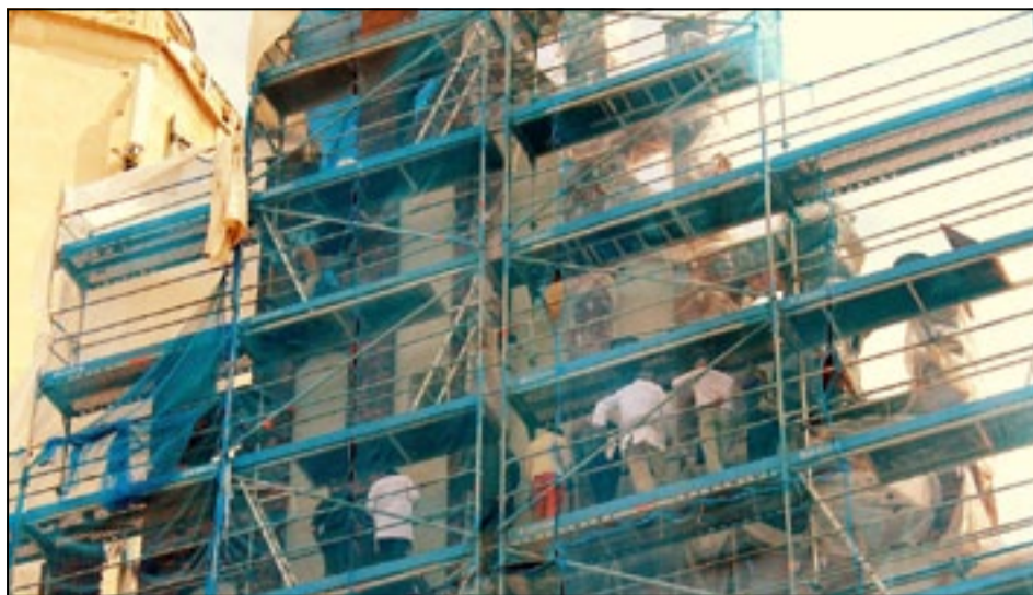
Eksperti oceniali postęp prac, zgodność ich wykonania z dokumentacją projektową i zastosowane materiały

Kościół pw. św. Jerzego jest najstarszym sakralnym zabytkiem Dzierżoniowa. Od kilku lat wewnątrz i na zewnątrz prowadzone są w nim konieczne i zarazem bardzo kosztowne prace konserwatorskie. Ich efekty oglądać możemy na co dzień.