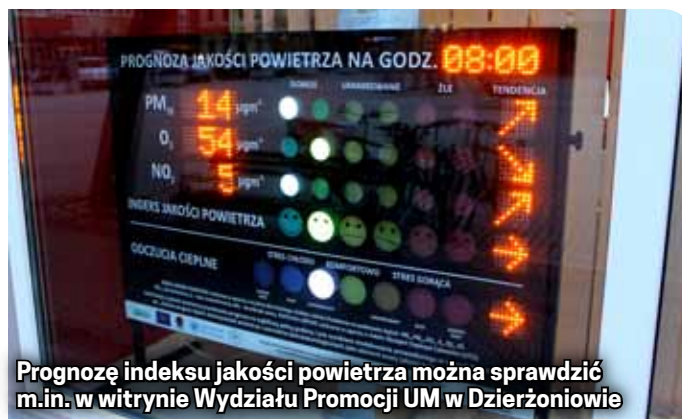
Prognozę indeksu jakości powietrza można sprawdzić m.in. w witrynie Wydziału Promocji UM w Dzierżoniowie

ste wskaźniki wyznaczone w oparciu o pomiary stężeń pyłu zawieszonego PM10, dwutlenku azotu NO2 i dwutlenku siarki SO2. Dla każdego z tych zanieczyszczeń wyznaczono sześć przedziałów stężeń (klas jakości powietrza), pozwalających ocenić panujące warunki. Każdej klasie przypisano również odpowiedni kolor, co znacznie ułatwia szybkie sprawdzenie, jakim powietrzem w danej chwili oddychamy. Dane te pobierane są ze stacji pomiarowej systemu monitoringu jakości powietrza przy straży pożarnej. Prognozowaną jakość powietrza może także śledzić na specjalnej tablicy elektronicznej znajdującej się w oknie biura promocji w ratuszu.