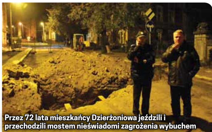
Przez 72 lata mieszkańcy Dzierżonowa jeździli i przechodzili mostem nieświadomi zagrożenia wybuchem

Ostatnia tak duża sytuacja kryzysowa zdarzyła się podczas powodzi w 1997 roku.