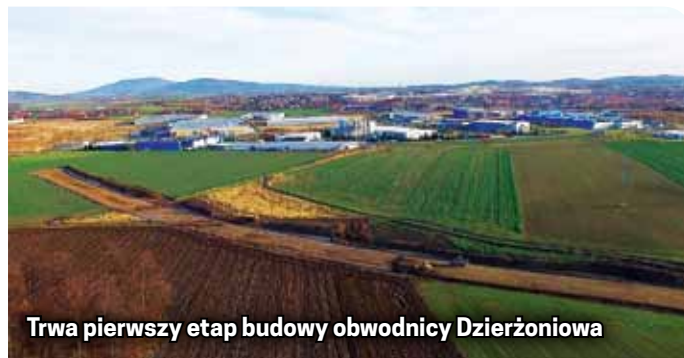
Trwa pierwszy etap budowy obwodnicy Dzierżoniowa

Widoczne prace skupiają się teraz na odcinku od drogi