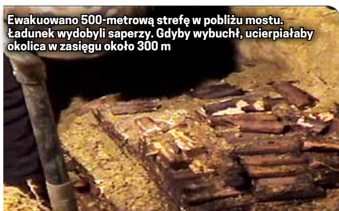
Ewakuowano 500-metrową strefę w pobliżu mostu. Ładunek wydobyli saperzy. Gdyby wybuchł, ucierpiałyby okolica w zasięgu około 300 m