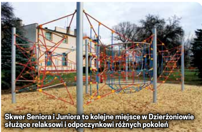
Skwer Seniora i Juniora to kolejne miejsce w Dzierżoniowie służące relaksowi i odpoczynkowi różnych pokoleń

linowy i huśtawka bocianie gniazdo, a wśród urządzeń fitness - biegacz, orbitek, wyciąg górny i urządzenie do wyciskania siedząc, a także prasa nożna i wioślarz. Cały skwer objęty jest monitoringiem, wyposażony w ławeczki i kosze na śmieci.