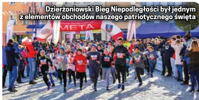
Dzierżoniowski Bieg Niepodległości był jednym z elementów obchodów naszego patriotycznego święta

Wszyscy zapisani uczestnicy otrzymali pamiątkowe numery startowe oraz słodki poczęstunek, a dodatkowo każdy z nich brał udział w losowaniu nagród rzeczowych. Na mecie na każdego czekał