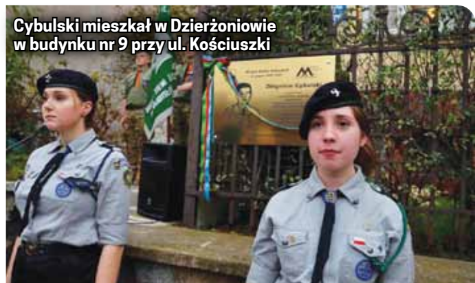
Cybulski mieszkał w Dzierżoniowie w budynku nr 9 przy ul. Kościuszki

Wernisaż wystawy uświetnił wykład Jolanty Manieckiej oraz dyskusja panelowa.