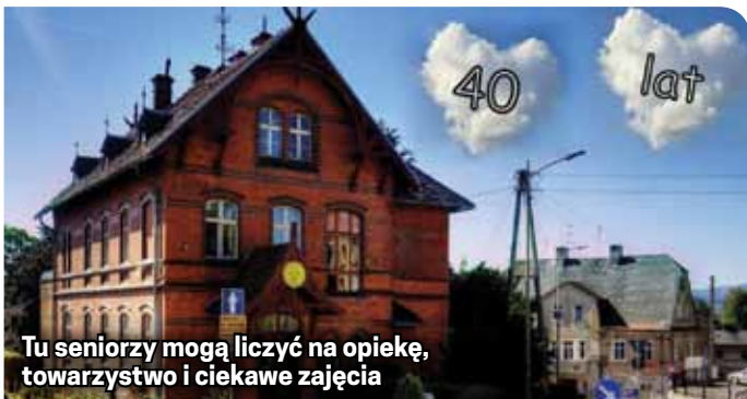
Tu seniorzy mogą liczyć na opiekę, towarzystwo i ciekawe zajęcia

Zaczął swą działalność w zabytkowym budynku przy ulicy Krasickiego 25 (willa „Radość Marty”) 2 listopada 1977 r. W kwietniu 1990 r. powołano do życia Ośrodek Pomocy Społecznej (OPS), w którego strukturze organizacyjnej wyodrębniono Dzienny Dom Pomocy Społecznej. W tym okresie placówka dziennej opieki współdzieliła budynek przy ulicy Krasickiego z Ośrodkiem Pomocy Społecznej aż do 25 stycznia 2010 r., gdy wydzielono ją jako odrębną jednostkę organizacyjną miasta. Pozyskano wtedy nowe sale do terapii zajęciowej i rehabilitacji. Dla usprawnienia funkcjonowania placówki i poprawy komfortu pobytu w niej seniorów przeprowadzono prace remontowe, obejmujące przebudowę części pomieszczeń, i konserwacyjno-remontowe, które przywróciły pierwotny układ architektoniczny wnętrza budynku.