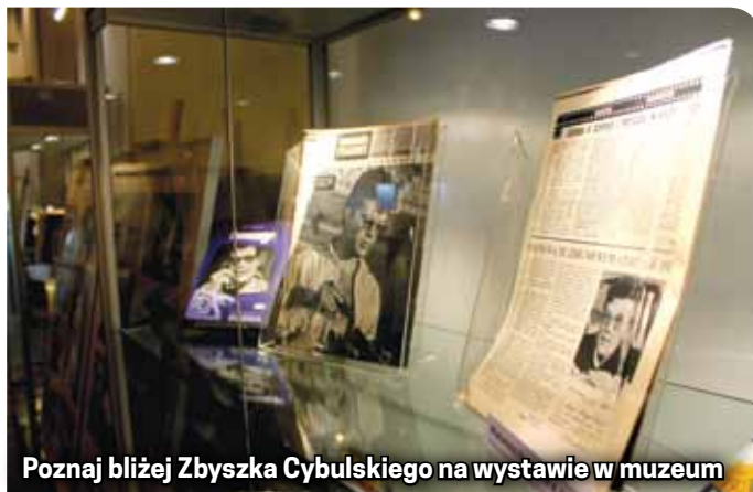
Poznaj bliżej Zbyszka Cybulskiego na wystawie w muzeum

Ekspozycja jest zaaranżowana tak, że odwiedzający mogą zobaczyć wiele ciekawych zdjęć udostępnionych zarówno przez Muzeum Narodowe w Gdańsku, Muzeum Historii Fotografii im. Walerego Rzewuskiego w Krakowie, jak i przez I Liceum Ogólnokształcące w Dzierżoniowie, Muzeum Miejskie Dzierżoniowa oraz osoby prywatne. - Pokazujemy także pamiątki związane z aktorem. Wśród zgromadzonych eksponatów wyróżniają się szczególnie te