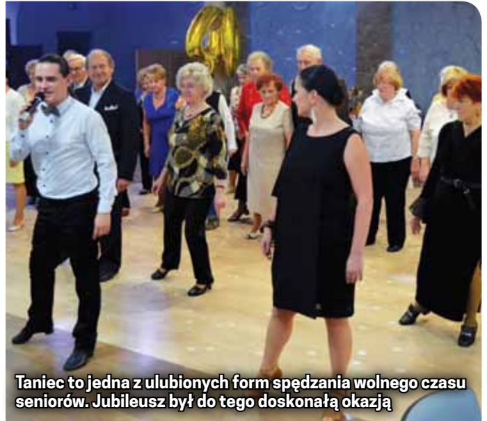
Taniec to jedna z ulubionych form spędzania wolnego czasu seniorów. Jubileusz był do tego doskonałą okazją

stepper, drabinki, materace). Seniorzy mogą korzystać z masażu i zabiegów fizykoterapeutycznych wykonywanych według zaleceń lekarskich. W placówce przyjmuje psycholog. Systematycznie prowadzone są zajęcia terapeutyczne, mię-