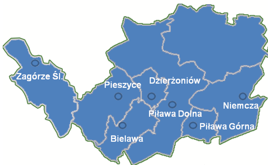
Rys. Gmina Walim oraz gminy powiatu dzierzoniowskiego.

Projekt pn. „Uporządkowanie gospodarki wodno-ściekowej na terenie gmin powiatu dzierzoniowskiego – etap I” zlokalizowany jest w województwie dolnośląskim, na terenie powiatu dzierzoniowskiego tj. w obszarze Gminy Miejskiej Dzierżoniów , gmin Bielawa , Pieszycy , Niemcza i Dzierżoniów oraz na terenie miejscowości Zagórze Śląskie w gminie Walim w powiecie wałbrzyskim.