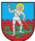
Gmina Miejska Dzierżoniów