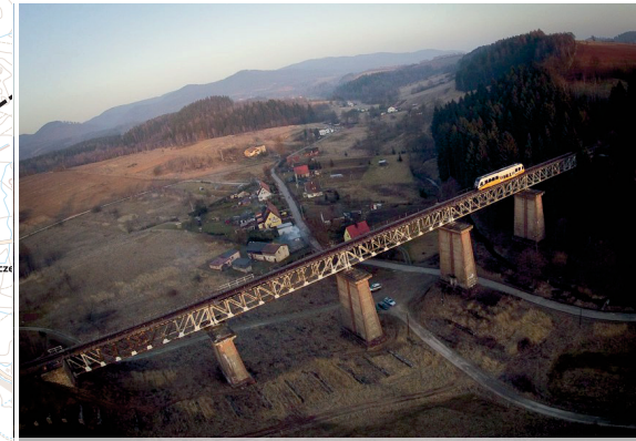
Podróżując linią kolejową Wałbrzych - Kłodzko (linia D9, D15), jedną z najpiękniejszych w Polsce, przejeżdżając przez 3 tunele, w tym najdłuższy w kraju (o długości 1604 m) oraz 6 okazałych wiaduktów.