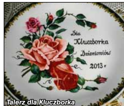
Talerz dla Kluczborka