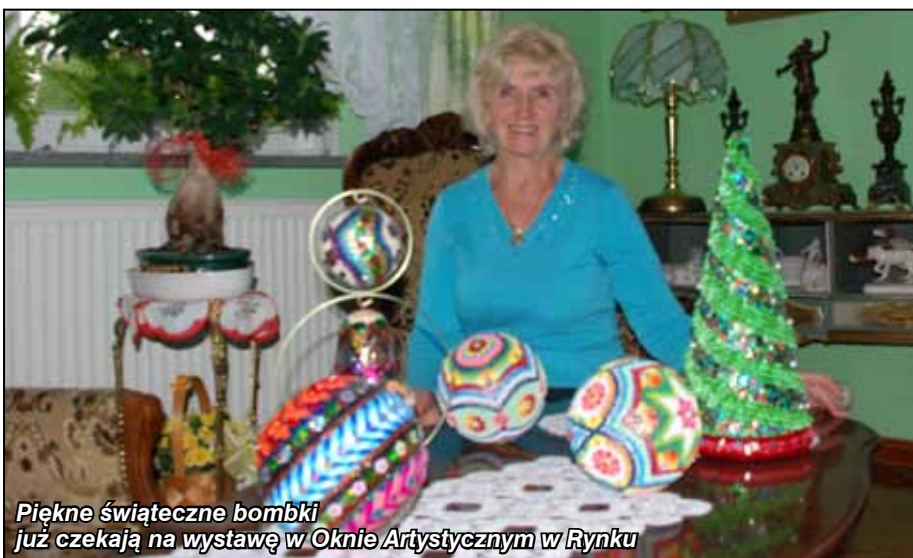
Piękne świąteczne bombki już czekają na wystawę w Oknie Artystycznym w Rynku

Zajęcia realizuje Klub Sportowy Niepełnosprawnych „Start” Dzierżoniów w ramach projektu „Razem lepiej”. Ponadto seniorzy mogą otrzymać wsparcie w zakresie indywidualnej diagnozy osobowości i umiejętności społecznych, poradnictwa psychologicznego oraz zajęć informatycznych, artystycznych i prozdrowotnych.