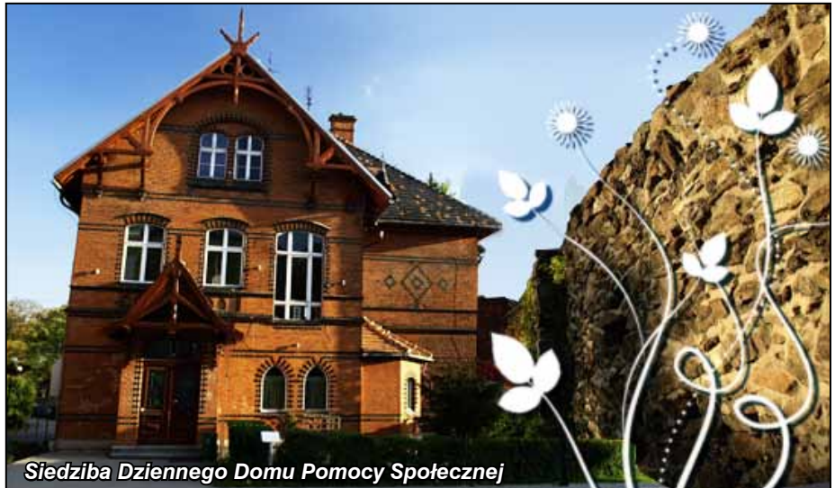
Siedziba Dziennego Domu Pomocy Społecznej

D zienny Dom Pomocy Społecznej to kolejne miejsce, gdzie seniorzy mają zapewnioną dzienną opiekę i gdzie aktywnie mogą spędzić czas.