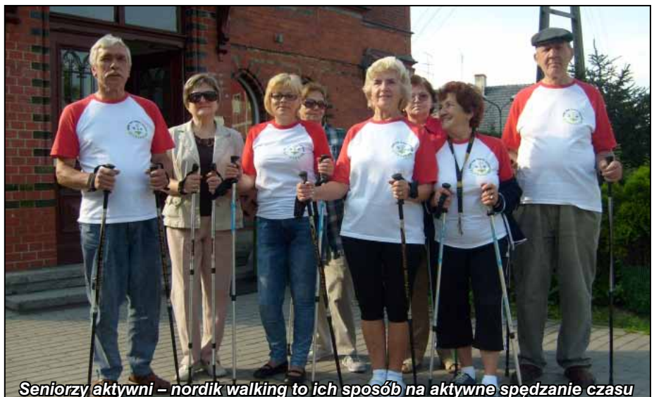
Seniorzy aktywni – nordik walking to ich sposób na aktywne spędzanie czasu

Przy Dziennym Domu Pomocy Społecznej funkcjonuje także Klub Seniora (spotkania odbywają się w czwartki o godzinie 16.00).