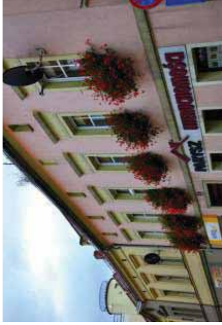
Akcja „Kwiaty w oknach”