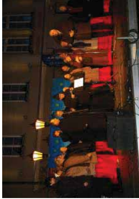
Koncert kołęd 2013