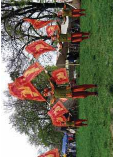
Jarmark Św. Jerzego 2013