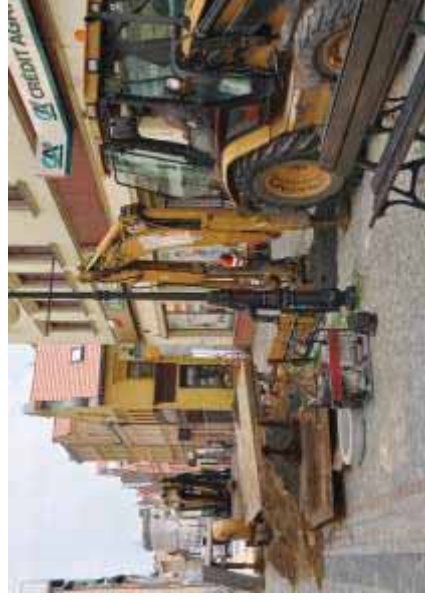
Uporządkowanie gospodarki wodno-ściekowej w centrum