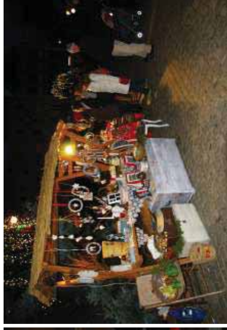
Jarmark Noworoczny 2013