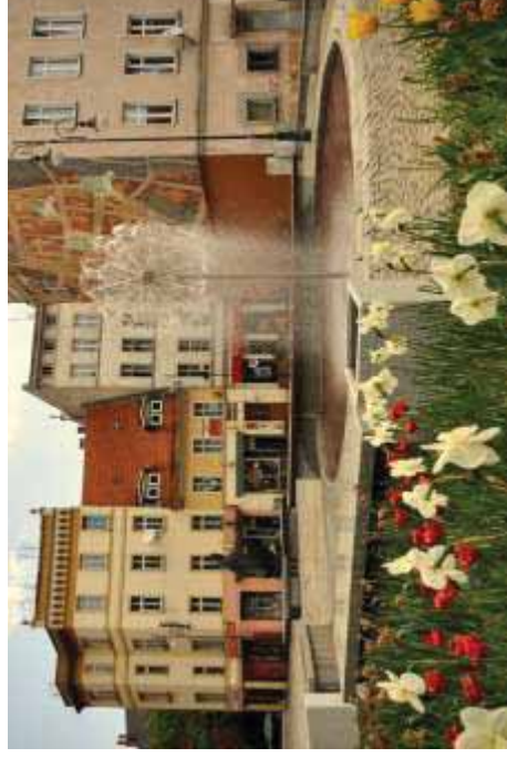
I nagroda w kategorii Detal ul. Szkolna 15