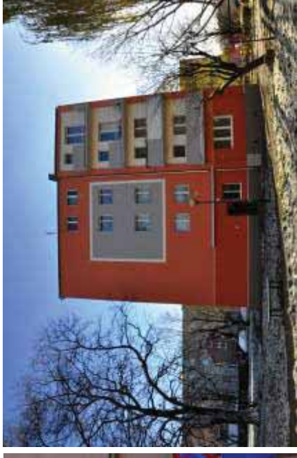
I nagroda w konkursie „Piękna Fasada” Kategoria elewacja os. Kolorowe 7