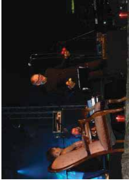
Poezja na murach 2013