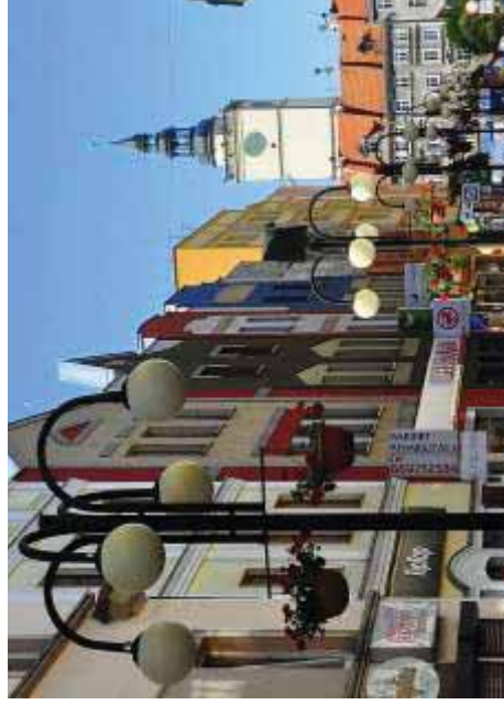
Ukwiecione ulice i skwery