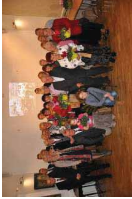
Rozstrzygnięcie konkursu „Piękno kwiatów i zieleni wokół nas”